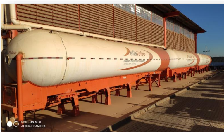
Tanques para captação de águas de chuva Contagem-MG

A Della Volpe investe em sistemas para aumentar a eficiência no uso de água, como a utilização de torneiras automáticas; captação de água da chuva para uso em banheiros; irrigação dos jardins; reservatório do sistema de incêndio, além de uma ETE (Estação de Tratamento de Efluentes) em nosso lavador de frota reutilizando a água tratada, reduzindo o impacto na utilização dos recursos hídricos.