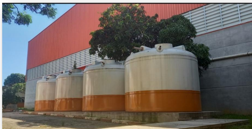
Tanques para captação de águas de chuva Matriz-SP